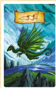
Chef de Guerre