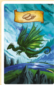
« Coût des Cartes »