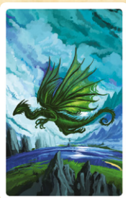
Créature ou Lieu